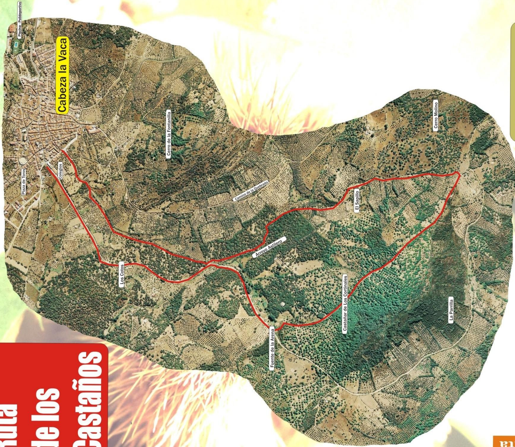
Perfil de la ruta